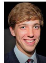
S.A.I.R. Archiduc Michaël d'Autriche