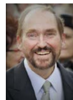
S.A.I.R. Archiduc Rudolf d'Autriche Père de huit enfants